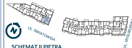
SCHEMAT II PIĘTRA