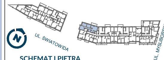
SCHEMAT I PIĘTRA