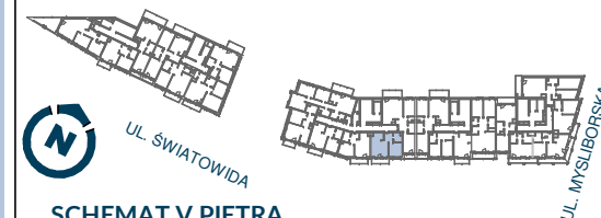
SCHEMAT V PIĘTRA