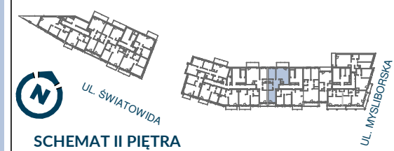
SCHEMAT II PIĘTRA