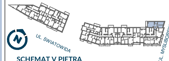
SCHEMAT V PIĘTRA