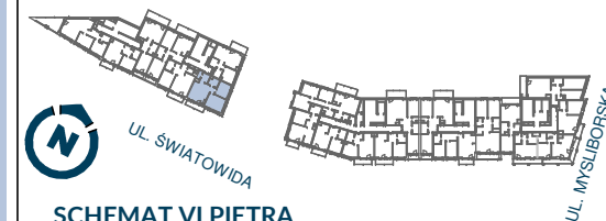
SCHEMAT VI PIĘTRA