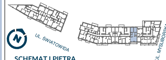
SCHEMAT I PIĘTRA