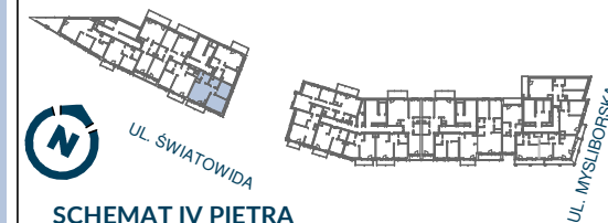
SCHEMAT IV PIĘTRA