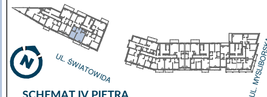
SCHEMAT IV PIĘTRA