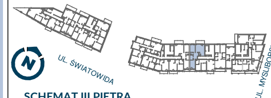
SCHEMAT III PIĘTRA