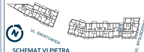
SCHEMAT VI PIĘTRA