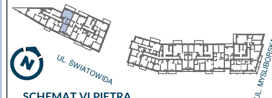
SCHEMAT VI PIĘTRA